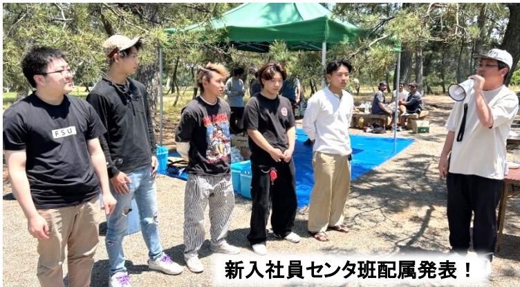
新入社員センタ班配属発表！