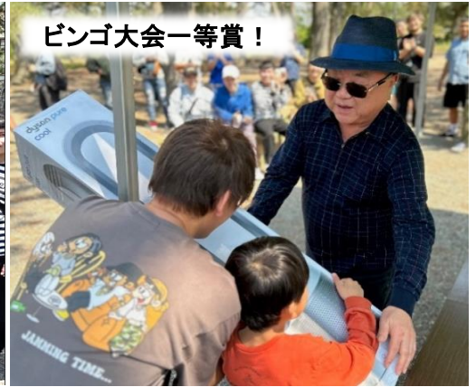
ビンゴ大会一等賞！