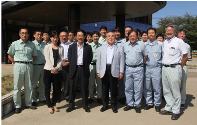
与小川生産本部長合影