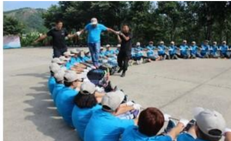
将绳拉至可以承担的起一个 100kg的人在上边走动