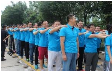
相互按摩、打破尴尬气氛